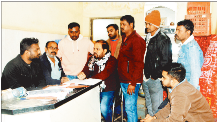
निगम की नोटिस के बाद आपस में चर्चा करते सब्जी व्यापारी।

शहर के प्रमुख चिल्हर सब्जी बाजारों में से एक बृहस्पति बाजार को मल्टी लेवल सब्जी बाजार बनाए जाने की योजना दो साल से चल