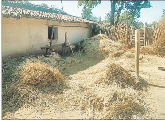
मृतका का घर।