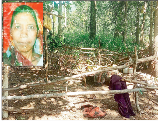
वह स्थल जहां हुई घटना (इंसेट में मृतका)।

एक दंपति अपने मवेशियों की निगरानी के लिए घर के समीप स्थित झाला में सोये हुए थे इस दौरान देर रात को दंतैल हाथी वहां जा धमका और हाथी की चिंघाड़ सुनकर