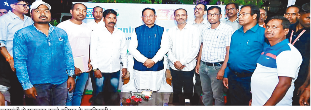
मुख्यमंत्री से मुलाकात करते यूनिन के पदाधिकारी।

छत्तीसगढ़ राज्य विद्युत कर्मचारी जनता यूनिन के प्रतिनिधिमंडल ने पुरानी पेंशन योजना की मांग को लेकर मुख्यमंत्री, महिला एवं बाल विकास मंत्री, अजा/जजा/ओबीसी एवं अल्पसंख्यक विकास मंत्री से चर्चा कर विद्युत कंपनी में पुरानी पेंशन योजना लागू करने की मांग की है।