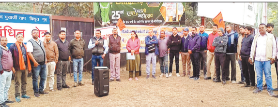
शक्ति प्रदर्शन करते यूनिन के पदाधिकारी।